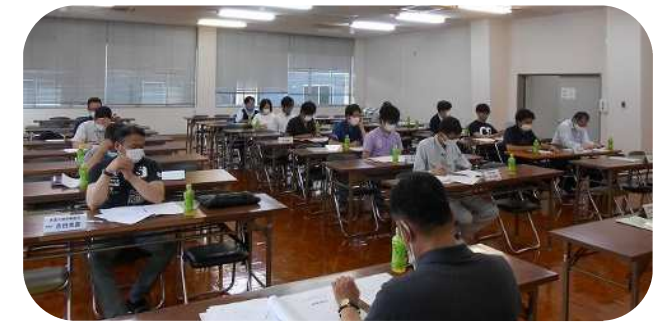
【ソーシャルディスタンスを取っての幹事会】

コロナ禍の中で幹事会も文書持ち回りで行っていましたが、約2ヵ月ぶりに顔を合わせての会議の開催となり嬉しく思います。