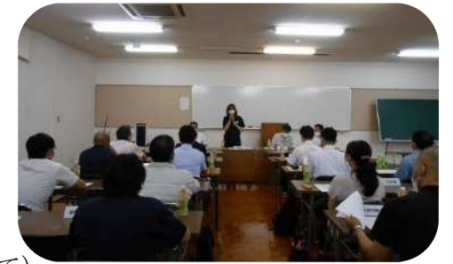
【樋渡委員長のあいさつ】