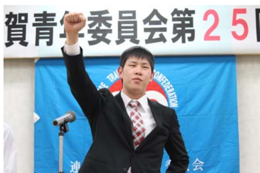
(委員長の力強い団結ガンバロー)