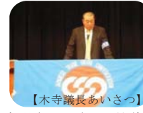
【木寺議長あいさつ】