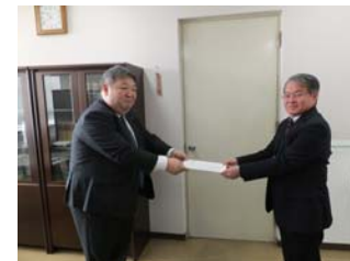
【武雄ハローワーク】