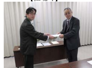
【鹿島ハローワーク】